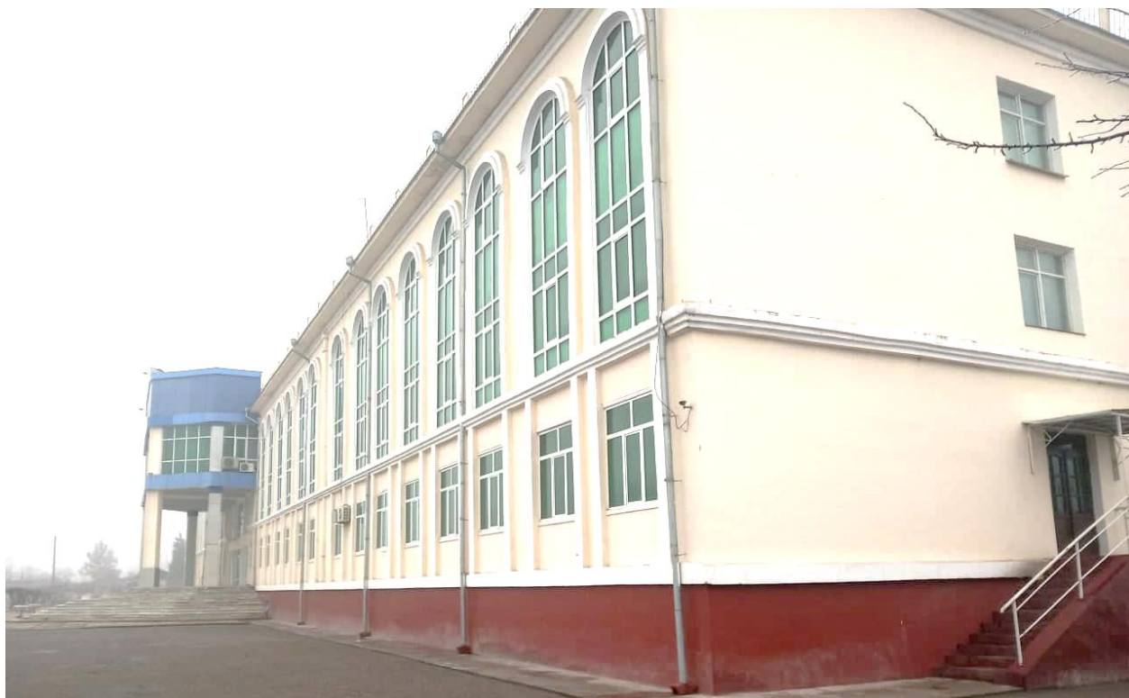
O'quv binosining yon ko'rinishi