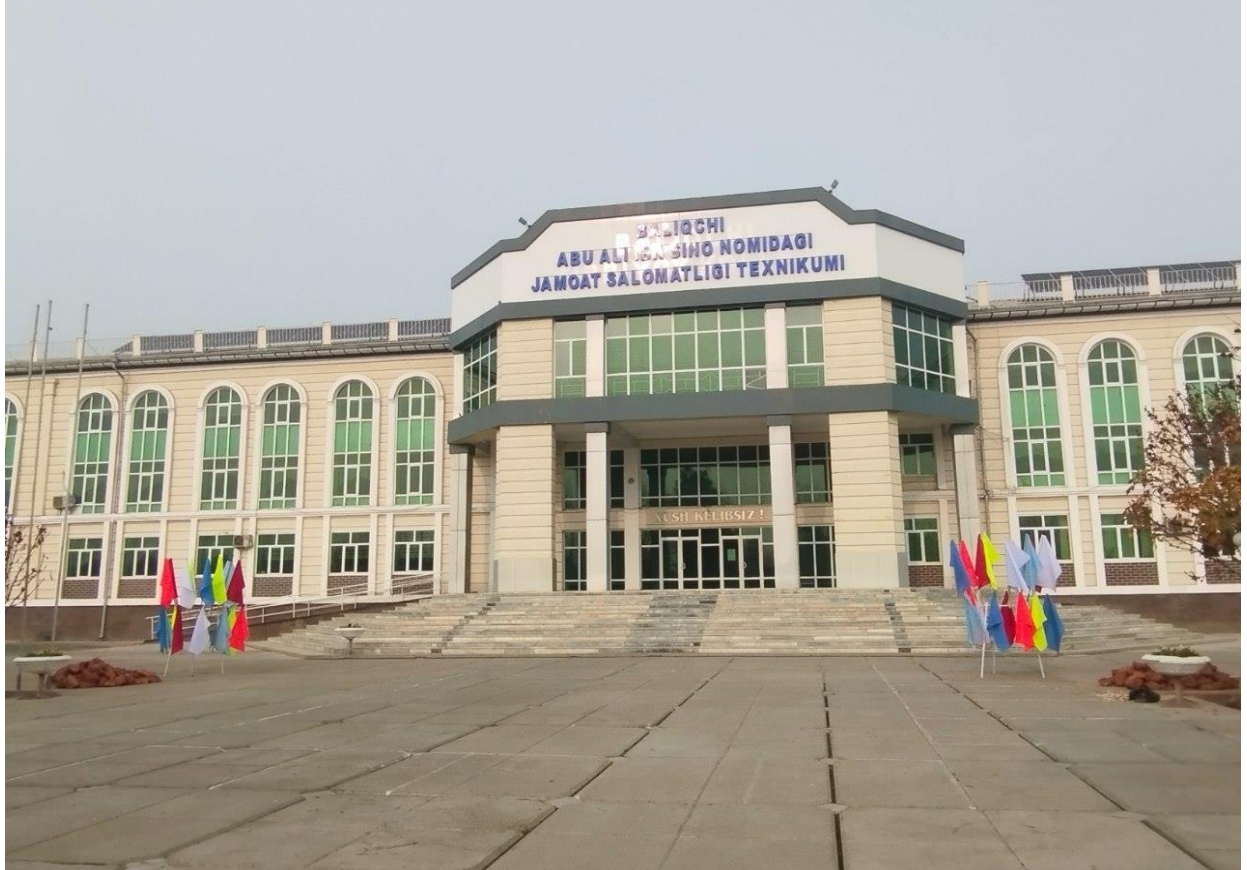
O'quv binosining oldi ko'rinishi