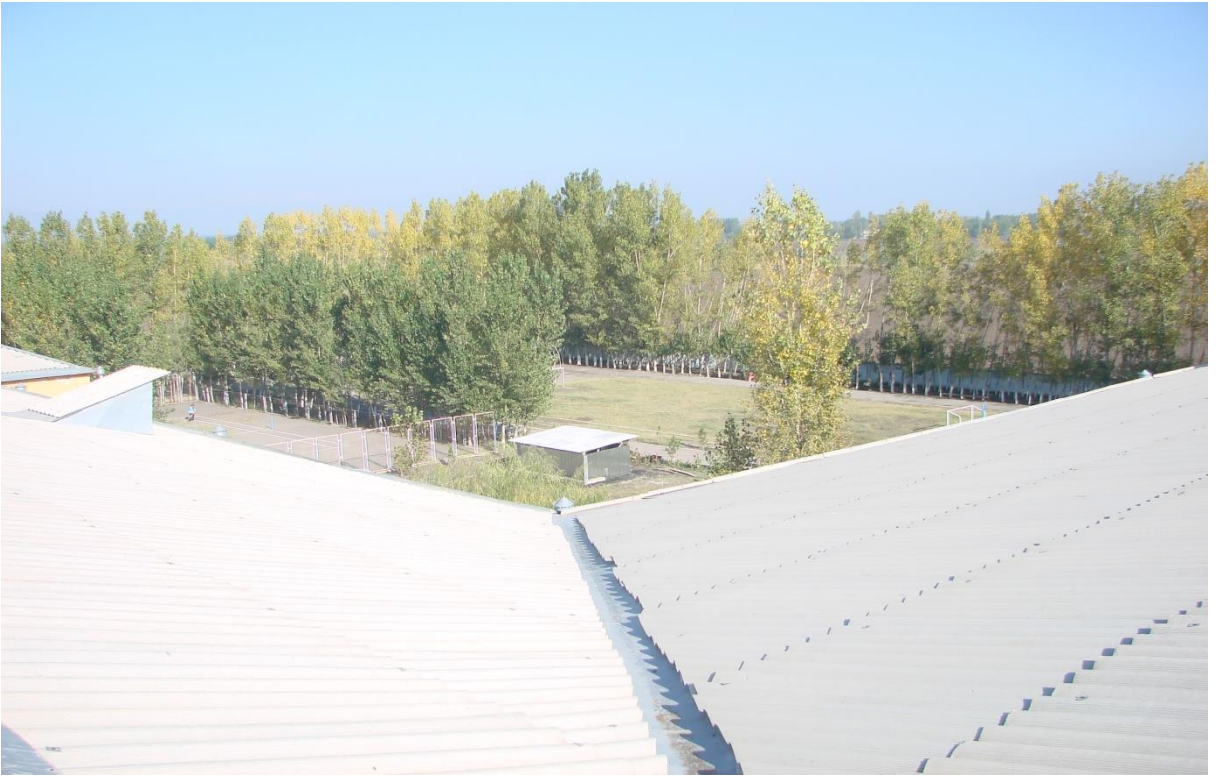
Sport zal tom qismi