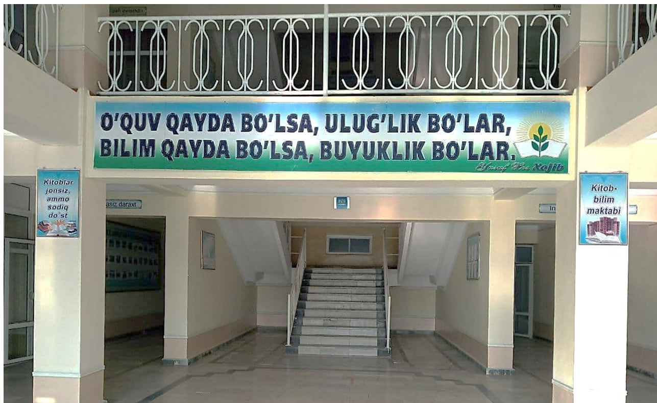
O'quv binosining foyesi