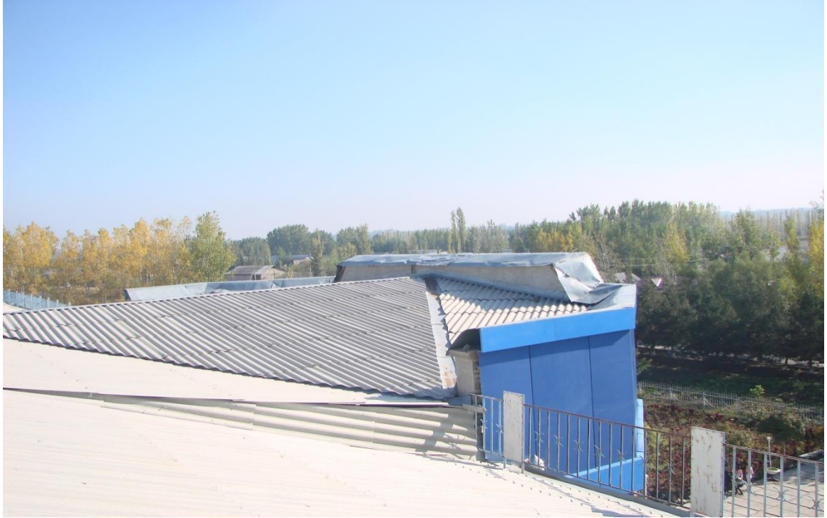
O'quv binosi tom qismi (3-blok)