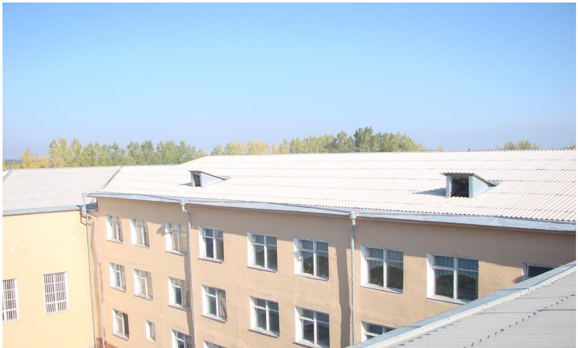
O'quv binosi tom qismi (2-blok)