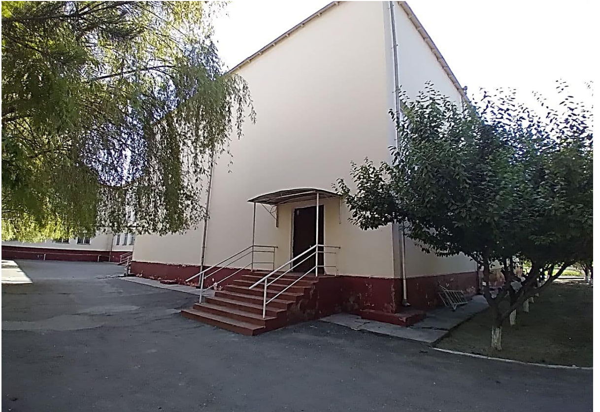
Sport zal binosi